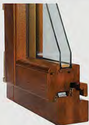
PROFILO IN LEGNO LAMELLARE

Insomma, un manufatto in legno di qualità non teme il trascorrere del tempo e sarà sempre il più ricercato.