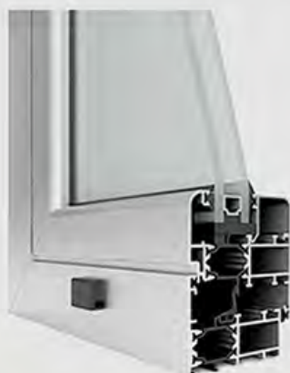
PROFILO A TAGLIO TERMICO

Oggi si è ovviato a questo problema mediante il taglio termico : si inseriscono dei particolari materiali con una bassa conducibilità termica in prossimità della camera interna degli infissi.